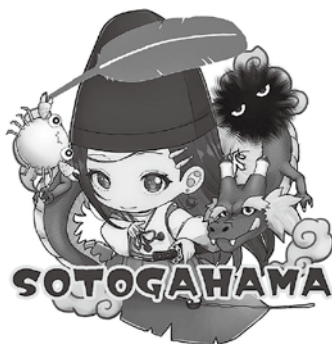
キャラクター 「風乃まち」