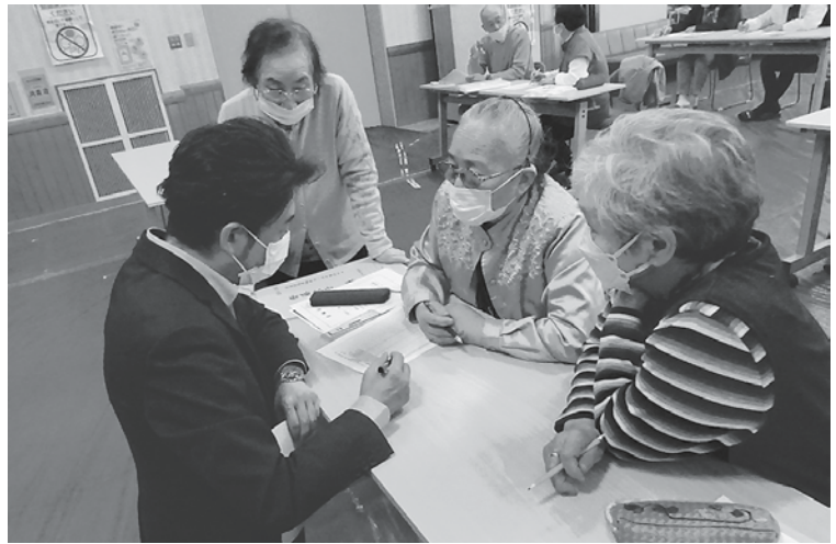
蟹田・平館地区の研修会

この事業は過疎高齢化が進む地域において見守りが必要な方を見守る研修会を蟹田・平館地区は合同で町総合センターなどわーるで三厩地区は交流センターかぶとで開催、27名が参加しました。協力員はボランティアとして、地域で見守りが必要な対象世帯の確認をしました。