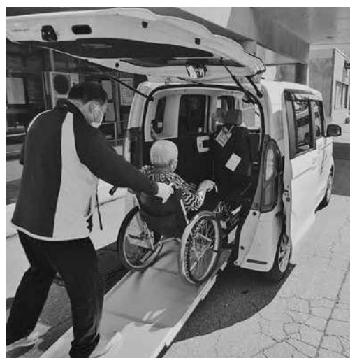
車いすのまま乗り降り出来ます