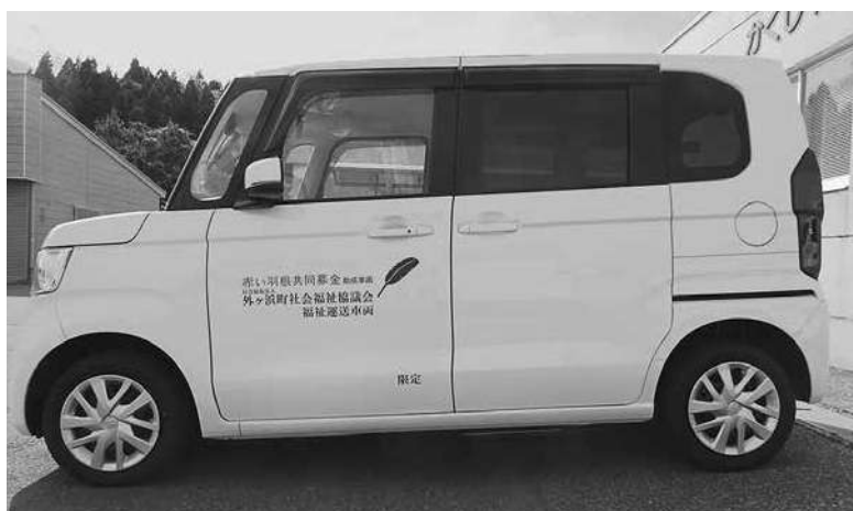
県共同募金会より移送サービス事業(病院への通院等)活動車両として配分を受けました