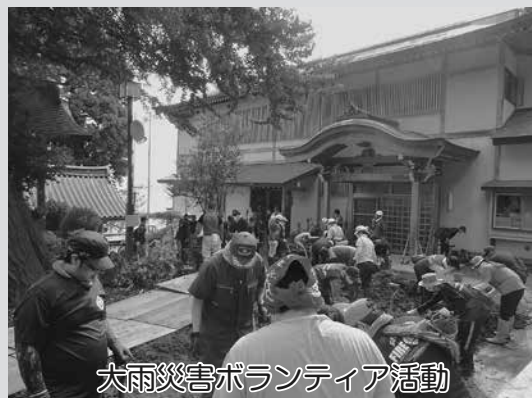
大雨災害ボランティア活動