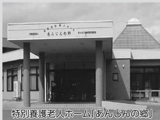
特別養護老人ホーム「あんじんの郷」