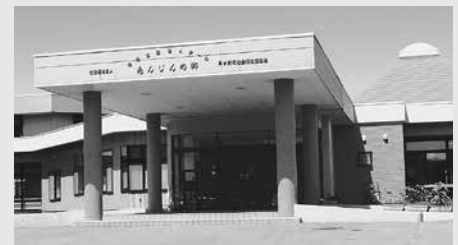
特別養護老人ホーム「あんじんの郷」