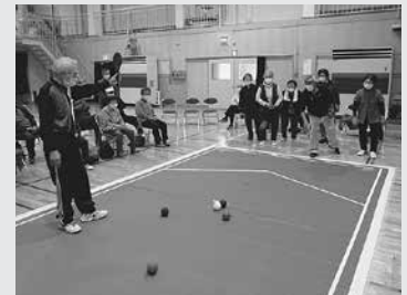
軽スポーツ講座 (ポッチャ)