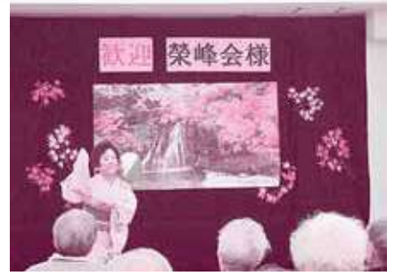
栄峰会の皆様、素敵な踊りをいつもありがとうございます