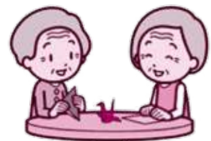
ほかにも書道教室やボイス紙相撲・謎解きゲームなどいろんな楽しみがいっぱいです。