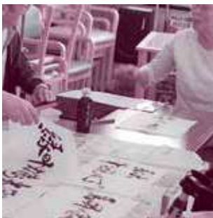
上手に書けたかな？