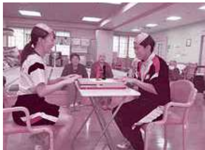
蟹田中学校体験学習が行われ3年生4名の生徒さんが来てくれました。生徒自身で考えたゲーム(ボーリング・紙相撲)を実施。交流を図りました