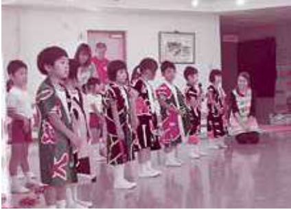
敬老会にて風のまちこども園の園児たちによる凜々しいよさこいです