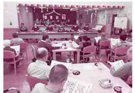
大正琴サークル「トレモロ」が訪問。童謡や歌謡曲などを演奏。舞踊も披露して頂きました。