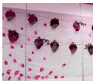
利用者様の作品も展示中