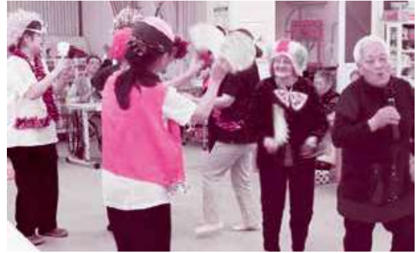
お誕生会のカラオケは、バックダンサー付きのスペシャルバージョン！