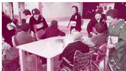
栄峰会の皆様素敵な踊りを披露して頂きました。来年の再会を約束して交流を図りました。