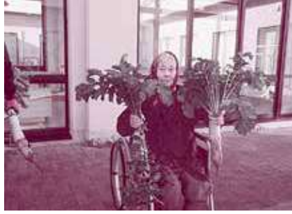
今年も中庭で大根等野菜を収穫しました