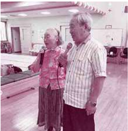
デュエットで素敵な歌声を披露して頂きました