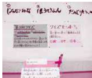
皆さん解りますか!?