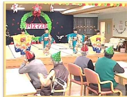
■園児との ふれあい

『お話がしたい…』『お風呂に安心して 入りたい…』『楽しく体を動かしたい…』 思いをかなえ、また来なくなるデイサービス を心がけています。皆様をお待ちしています。