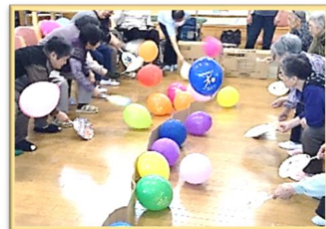
■レクリエーション(風船パレーゲーム)